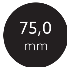
Länge der einzelnen Abschnitte